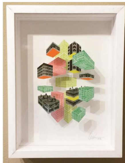
Usted No Está Aquí Serie: Usted No Está Aquí Acrílico serigrafiado 40 x 30 x 8 cm 900,00€ + IVA