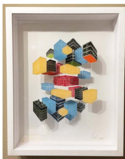
Usted No Está Aquí Serie: Usted No Está Aquí Acrílico serigrafiado 50 x 40 x 8 cm 1.500,00€ + IVA