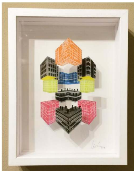
Usted No Está Aquí Serie: Usted No Está Aquí Acrílico serigrafiado 40 x 30 x 8 cm 900,00€ + IVA