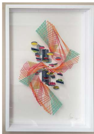
Rotación y Traslación IX