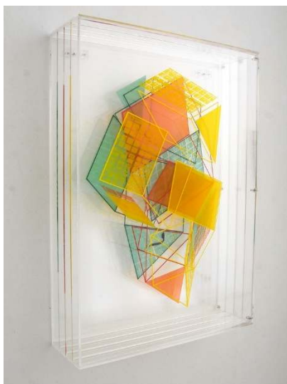
Devenir de la multiplicidad I Serie: Devenir de la multiplicidad Acrílico serigrafiado 70 x 50 x 15 cm 2.300,00€ + IVA