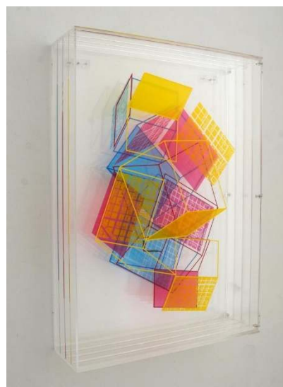
Devenir de la multiplicidad II Serie: Devenir de la multiplicidad Acrílico serigrafiado 70 x 50 x 15 cm 2.300,00€ + IVA