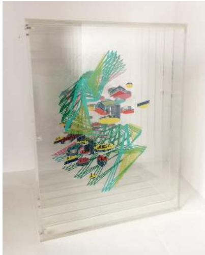
Rotación y Traslación VIII Serie: Rotación y Traslación Acrílico serigrafiado 42 x 32 x 25 cm 2.500,00€ + IVA