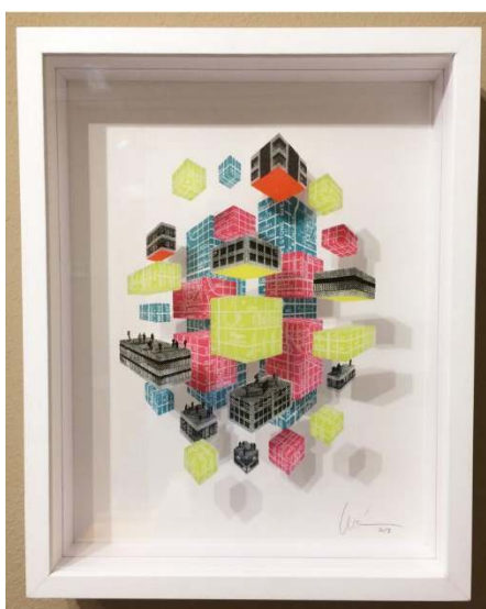
Usted No Está Aquí, Serie: Usted No Está Aquí Acrílico serigrafiado 50 x 40 x 8 cm 1.500,00€ + IVA