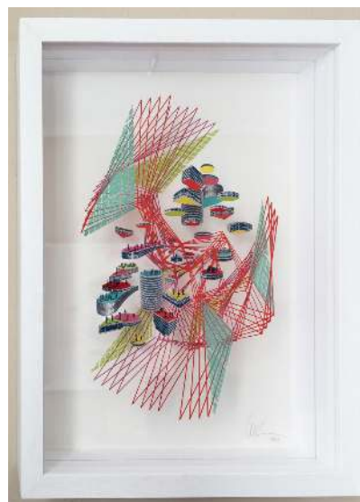
Rotación y Traslación XII, 2021