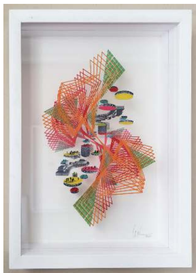
Rotación y Traslación XIV, 2021