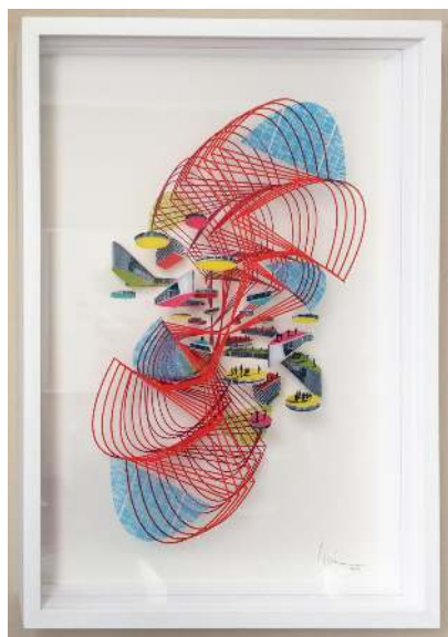
Rotación y Traslación X,